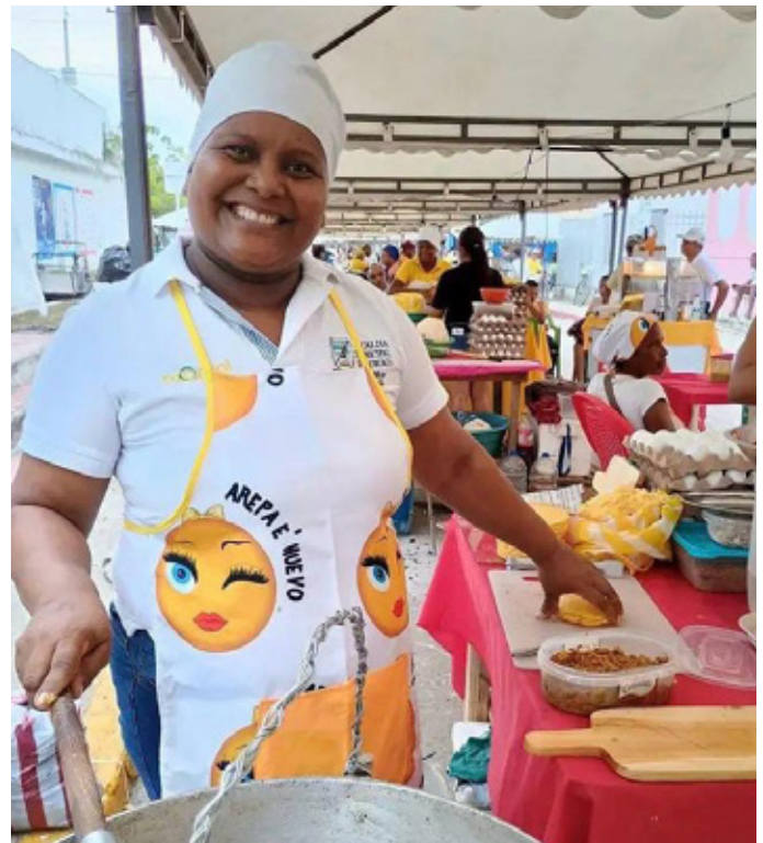
Matrona hacedora de arepa de huevo de Luruaco (Atlántico)

Con relación al sector comercio de la economía popular, las ventas urbanas al menudeo son las que mejor caracterizan el sector, Coraggio (2016).