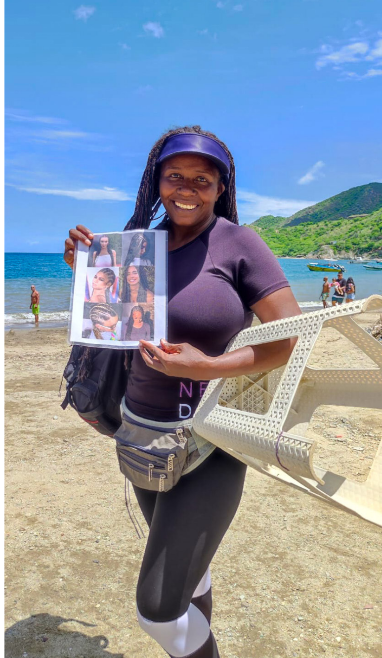
Corregimiento de Taganga (Santa Marta)

Es relevante aclarar que, la población de la economía popular puede pertenecer tanto a entornos urbanos como rurales, barrios, zonas ribereñas, las costas. Adicionalmente, representa un aporte al desarrollo local de las regiones.