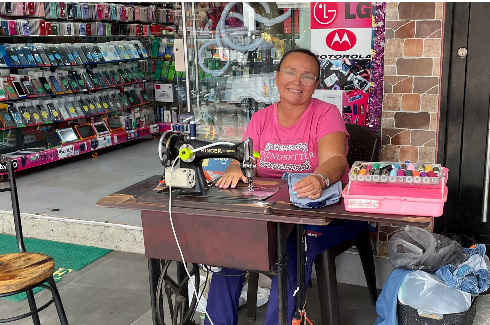
Comerciante de la economía popular (Puerto Inirida)

Aunque no se trata de un concepto nuevo, sí de un concepto cambiante; las discusiones alrededor de la economía popular incluyen temas relacionados con el autoempleo, las unidades productivas de pequeña escala, los límites entre formalidad e informalidad, las economías inclusivas, la asociatividad, la reindustrialización, los micronegocios, el bajo valor agregado, entre otros.