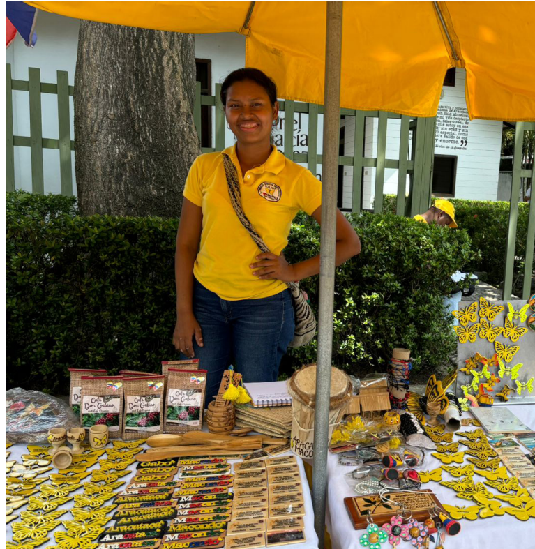
Municipio de Aracataca (Magdalena)

Formación para el trabajo: La Entidad cuenta con un catálogo de cerca de 2.000 programas de formación relacionados con la Economía Popular que ya están disponibles en las convocatorias. Además, en el Observatorio Laboral y Ocupacional del SENA se trabaja en la construcción de un ‘Catálogo Ocupacional de la Economía Popular’ para identificar las ocupaciones que tienen relación directa con este sector económico.