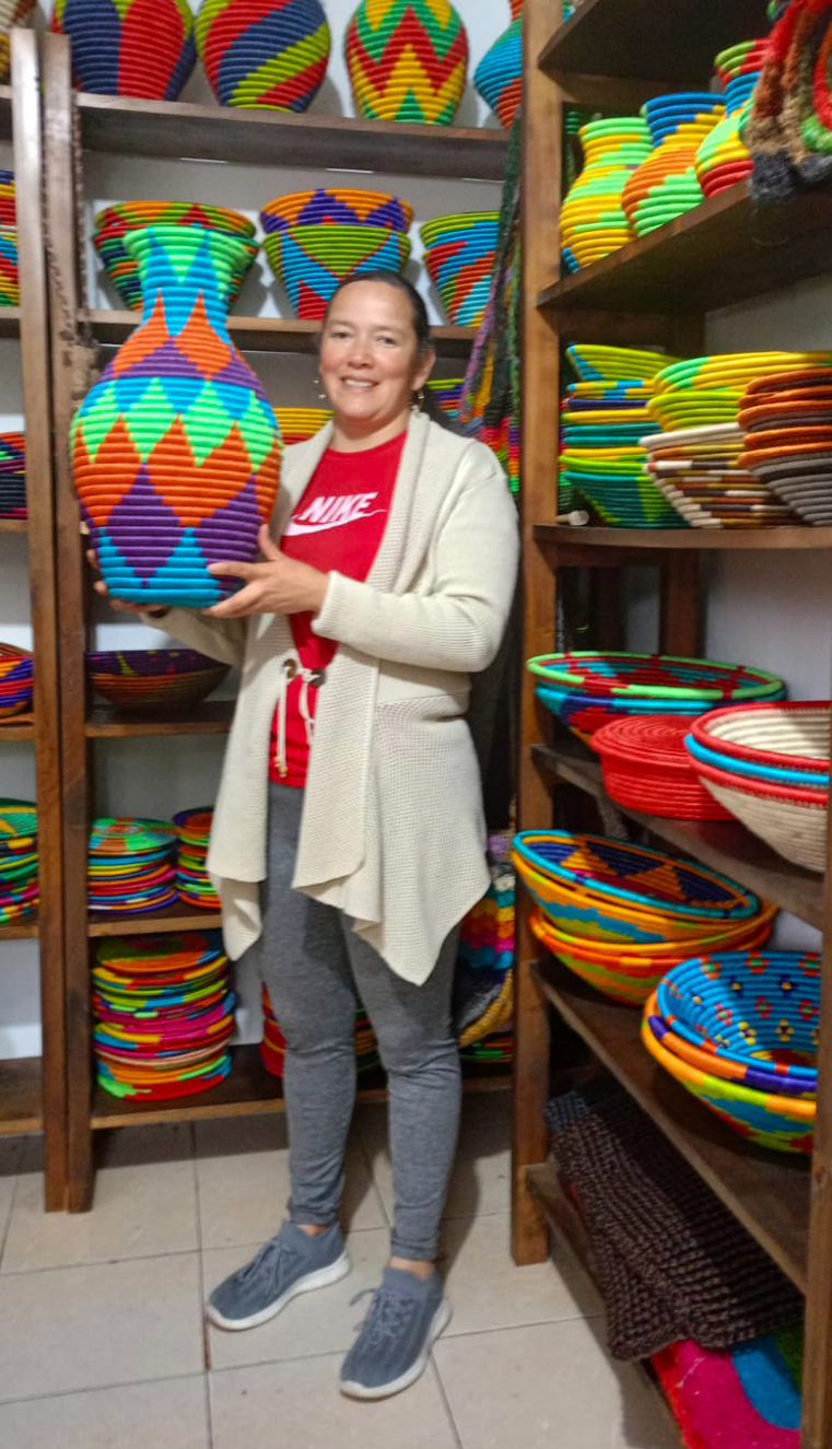
Artesana de Guacamayas (Boyacá)