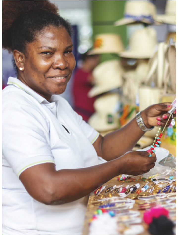
► Mujeres y hombres que recibieron el apoyo del SENA participaron en la Feria Nacional de Maestros Artesanos, realizada durante el Reinado Nacional del Bambuco.