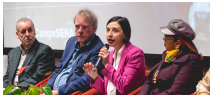
► La ministra de Agricultura y Desarrollo Rural, Martha Viviana Carvajalino, asistió a la charla y destacó que el Gobierno promoverá el progreso de los campesinos.