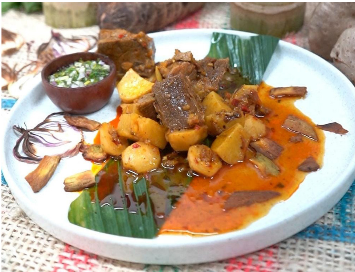
► 'Patas de Buey', plato ganador del festival que se realizó en Riohacha.

Con un ambiente festivo y emocionante, concluyó el 2.º Festival 'El SENA Cocina' del campo colombiano a la mesa. El premio total de $9.000 millones se repartió entre los tres primeros lugares: Risaralda triunfó con la receta de 'Patas de Buey', Putumayo fue 2do con el 'Ceviche Amazónico' y Boyacá 3ro con 'Los Indios Sotaquireños' . Fueron dos días llenos de aromas, sabores, experiencias académicas y tradiciones.