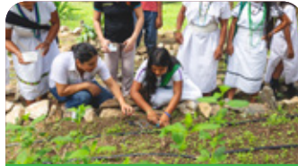
Formación en veredas y fincas