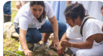
Proyectos de innovación para la tecnificación del campo