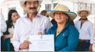
Certificación de Competencias Laborales

Entre las acciones destacadas de la agenda del profesor en el país se incluyeron: