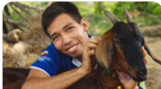
Recursos para formación especializada de organizaciones campesinas