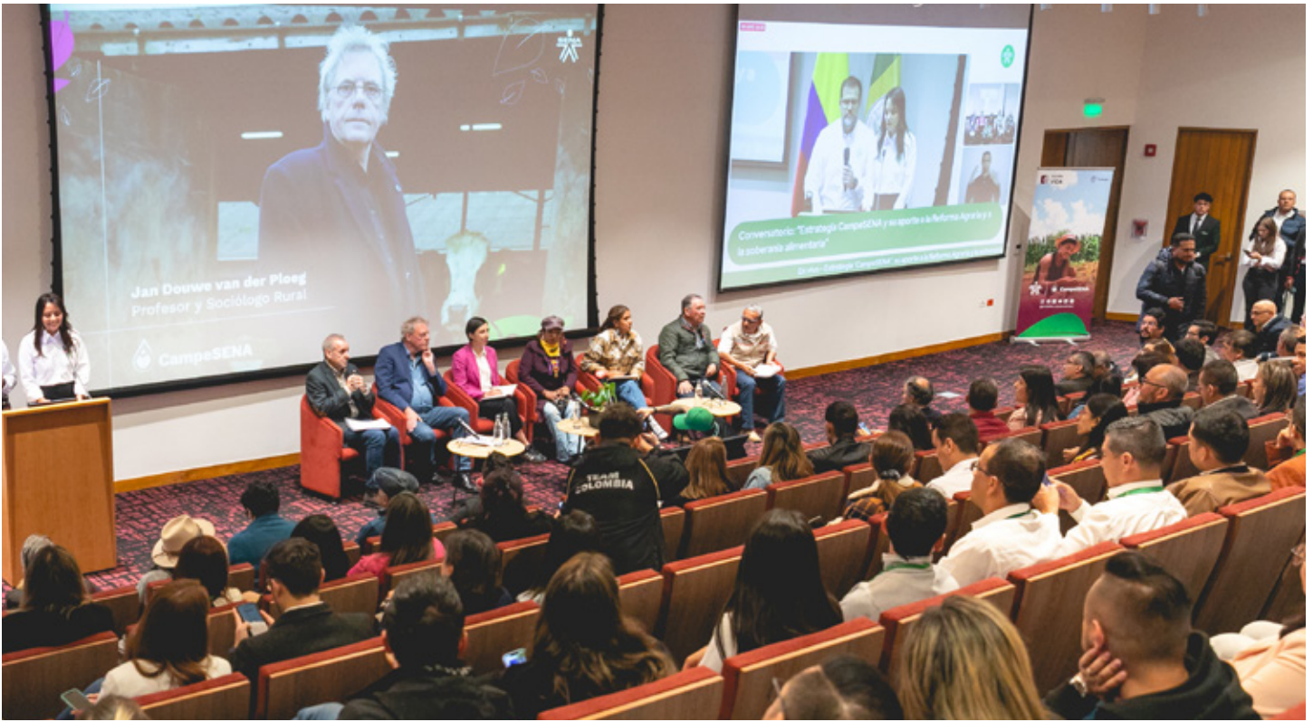
► Uno de los puntos más relevantes de la agenda del experto holandés en Colombia tuvo lugar en la Universidad Externado de Colombia. Allí se realizó el conversatorio 'La estrategia CampeSENA y su aporte a la reforma agraria y la soberanía alimentaria'.