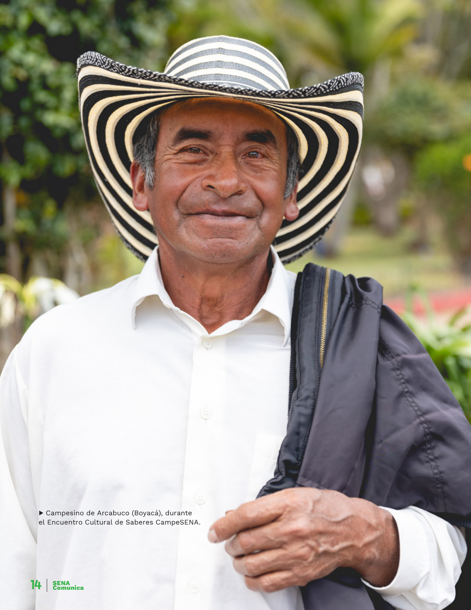
► Campesino de Arcabuco (Boyacá), durante el Encuentro Cultural de Saberes CampeSENA.