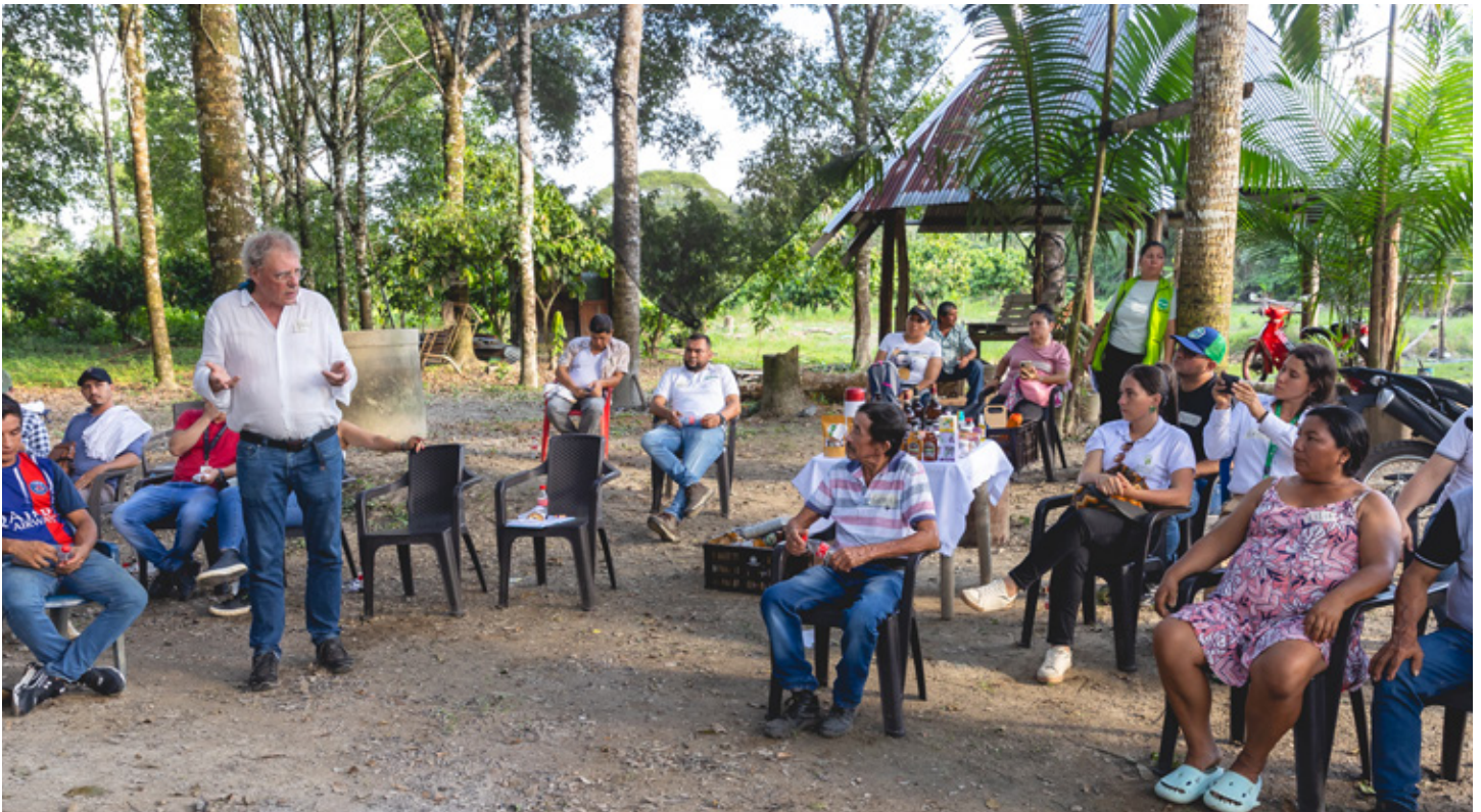
► Los 'Diálogos CampeSENA' culminaron en Guaviare, donde el profesor Van der Ploeg, experto holandés en desarrollo rural, dejó una huella significativa en más de mil campesinos y representantes de organizaciones.