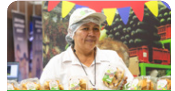
Recursos para emprendimientos y unidades productivas agro