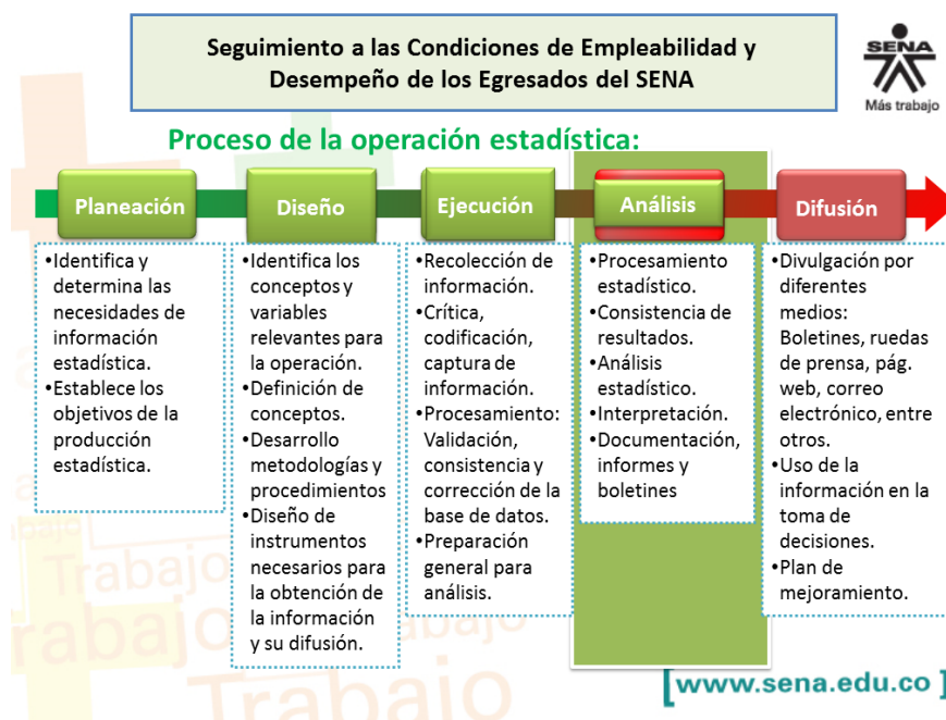
Ilustración 1 Modelo del proceso estadístico para el seguimiento a los egresados del SENA.