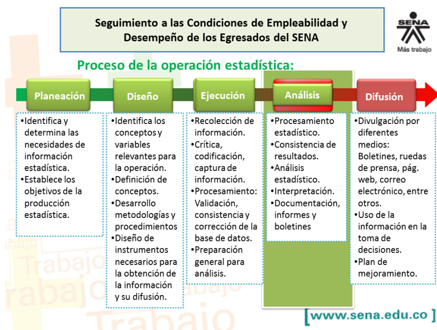
Ilustración 1 Modelo del proceso estadístico para el seguimiento a los egresados del SENA.